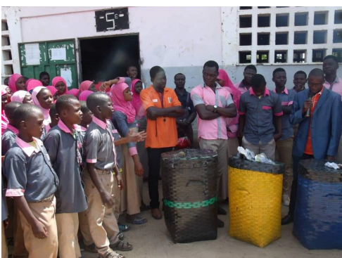
Erste Sammelergebnisse und Auswertung

Von Oktober 2019 bis Februar 2020 wurde durch die konsequente Mülltrennung an den 20 Schulen bereits knapp 30 % des Restmülls eingespart.