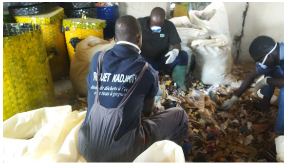
Nachsortieren des erfassten Mülls aus den Behältern