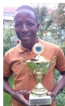
Wanderpokal für die sauberste Schule