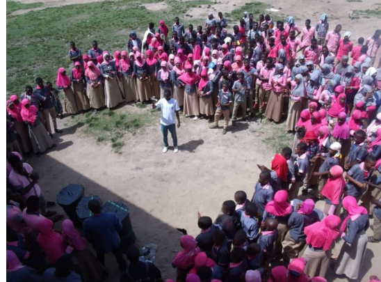
Informationsveranstaltungen an zwei unterschiedlichen Schulen