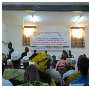
Teilnehmer an Workshops mit Vertretern der Stadtverwaltung Sokodé