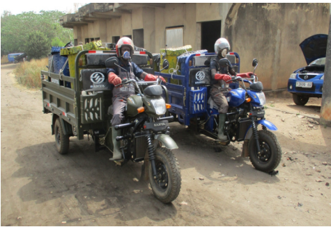
Die Müllfahrzeuge holen die gefüllten Behälter aus den Schulen ab und bringen sie zum Lager