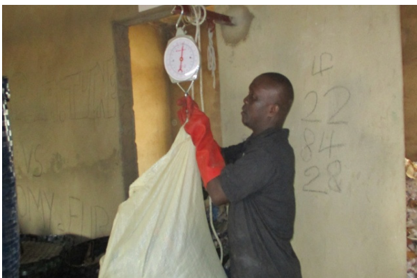
Wiegen des sortierten Mülls

Von Oktober 2019 bis Februar 2020 wurde durch die konsequente Mülltrennung an den 20 Schulen bereits knapp 30 % des Restmülls eingespart.