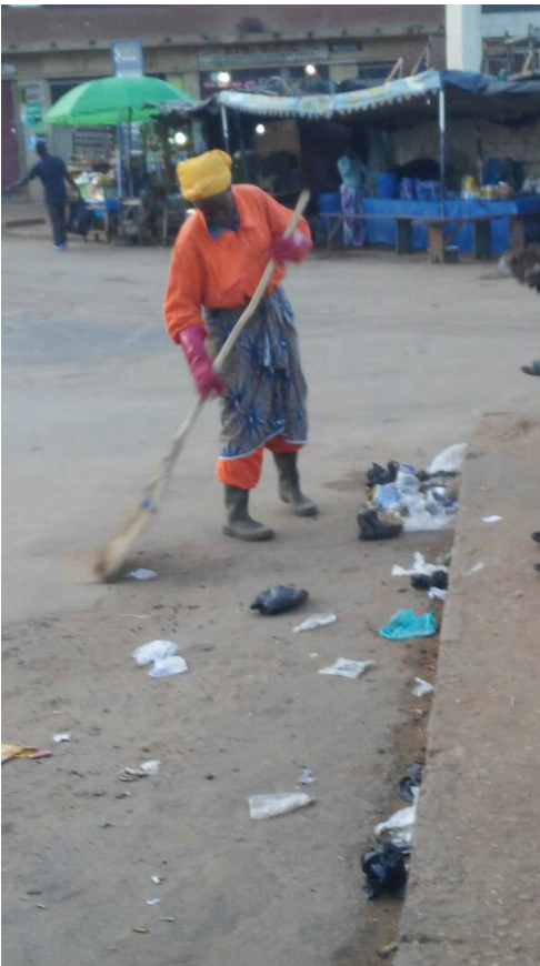
Zwei Beispiele für den Stand der gegenwärtigen Straßenreinigung und Müllentsorgung.

Durch die wilden Müllkippen, teilweise direkt angrenzend an Wohngebiete, und die oft feuchtwarme Witterung kommt es zum Ausbruch von Krankheiten und immer wieder auch zu Epidemien.